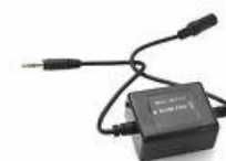
Abbildung 6: Entstör Filter mit Klinkenstecker u. -buchse

Einbau in der Leitung Android Box → Funkgerät (grüne Steckverbindung)