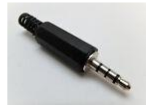
Abbildung 4: Klinkenstecker 4-polig

* Wichtig: Lautsprecher und Mikrofon werden vertauscht!