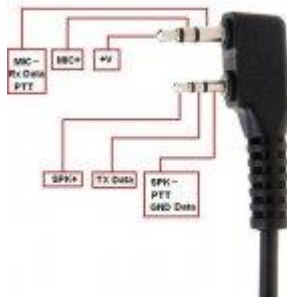
Abbildung 2: Stecker Belegung