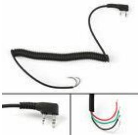
Abbildung 1: fertiges Kabel mit offenem Ende

Doppelklinkenstecker nach Kenwood Belegung